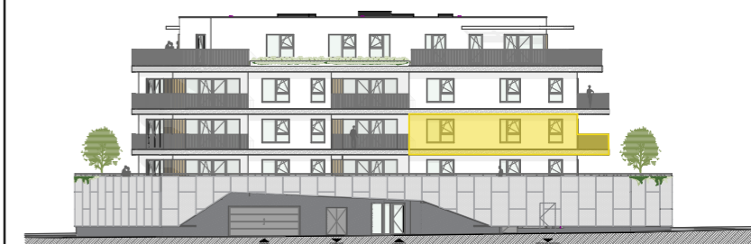
Façade Avenue Albert 1er